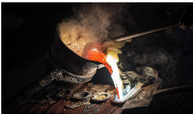
En haut : travail de ciselure au sein des ateliers Delisle. Ci-dessus : fonderie de bronze d'art.